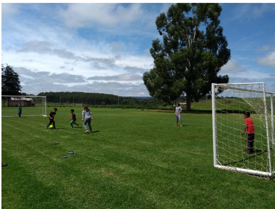
Campo de futebol

A instituição dispõe de área para prática de atividades esportivas, como: campo de futebol, vôleibol, quadra poliesportiva, piscina, tanque para pesca e outros.